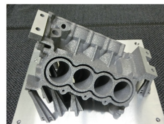
後工程用基準面の切削