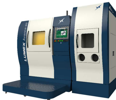
LUMEX Avance-60 (パネル・映像展示)