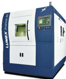
LUMEX Avance-25 (実演展示)