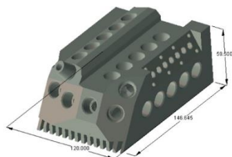
図. 評価ワークの加工比較

[材 質] アルミ (147x120x60mm) [使用工具本数] 12 本 [主軸回転速度] 2,000~12,000 \text{min}^{-1}