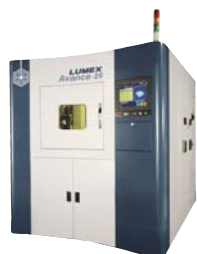
金属光造形複合加工機 LUMEX Avance-25