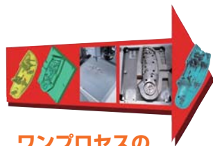
ワンプロセスの 金型ソリューション