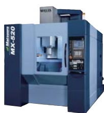
5軸制御立形マシニングセンター MX-520